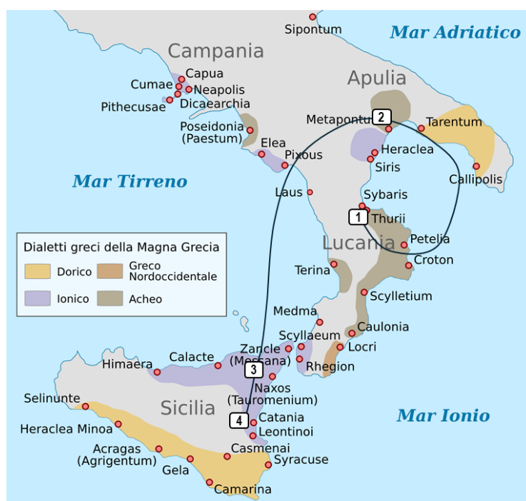
Gli alleati magno-greci durante la guerra in Sicilia (Th. 7.57–8)

Nella presentazione degli alleati in Italia, una volta fissata Turi quale principale alleata (per via della sua storia di fondazione e del suo ruolo quale ‘Atene di Magna Grecia’), da questo centro, si procede a elencare prima sulla terraferma Metaponto assieme alla colonia periclea; poi, Nasso e Catania, in Sicilia, seguendo sempre il senso antiorario. In questo particolare passaggio del catalogo, però, Tucidide va dal ‘centro’ (Turi) alla periferia (Catania). Essendo evidentemente meno rilevanti, fanalino di coda sono, dopo i sicelioti di Nasso e Catania, i barbari (di Segesta, ma pure gli Etruschi e gli Iapigi).